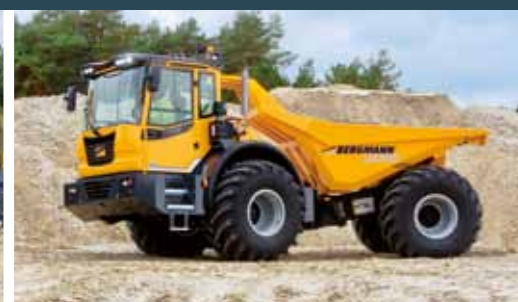
Bergmann 3012 HK PLUS Dumper med baktipp.