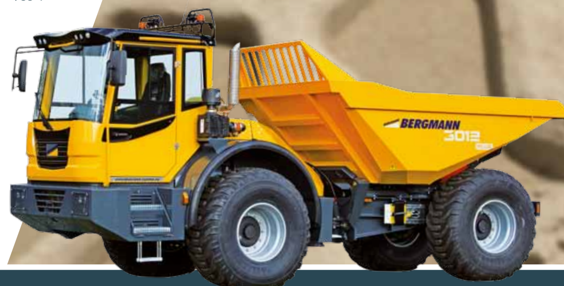
Bergmann 3012 R PLUS

Baktipp, treveistipp eller dreibar tipp 12 tonn nyttelast