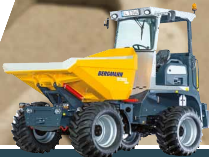
Bergmann 2060 R PLUS