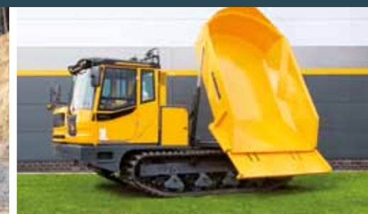
Bergmann 4010 R Dumper med dreibar tipp og nytt, komfortabelt førerhus.