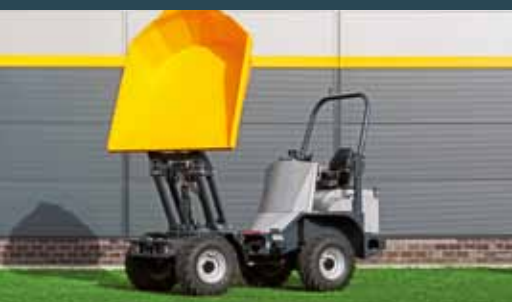
Bergmann 2030 HS Dreibar tipp som kan heves opptil 2 meter.