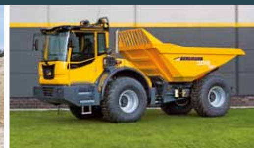
Bergmann 3012 R PLUS Dumper med dreibar tipp og nytt, komfortabelt førerhus.