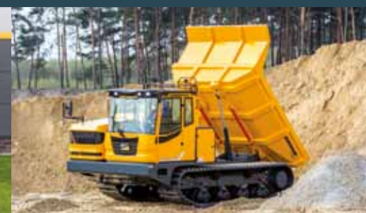
Bergmann 4010 HK Dumper med baktipp.