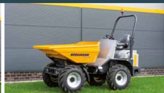
Bergmann 2040 R Dumper med dreibar tipp.