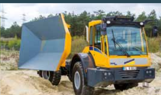
Bergmann 3012 DSK PLUS Dumper med treveistipp.