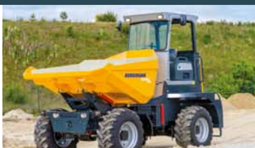
Bergmann 2090 R PLUS Med nedsenkbart værbeskyttelsestak.