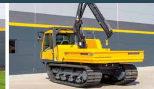
Bergmann 4010 T Bærekjøretøy for dine overbygninger.