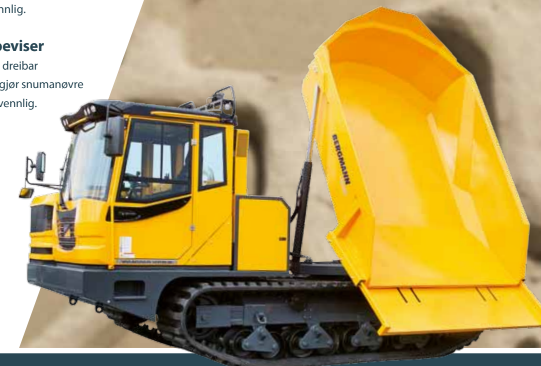
Bergmann 4010 R

Baktipp eller dreibar tipp 10 tonn nyttelast